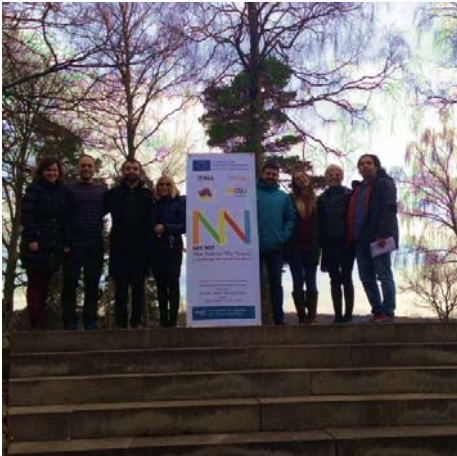
El equipo completo al final del día- entrega de certificados y foto de despedida.